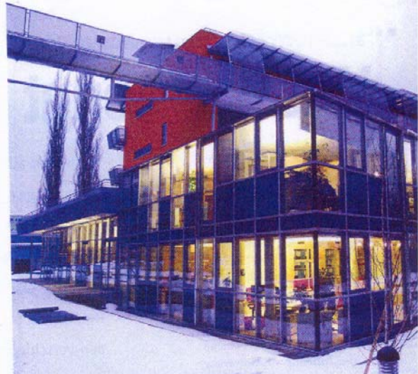
Einladend: Die neue Heimat der „Neue Heimat Wohnungsgesellschaft m.b.H.“ in der Theodor-Körner Straße in Graz kann sich sehen lassen – und tut das auch. Interessenten können gerne den einen oder anderen Blick in das Gebäude werfen.